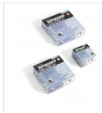
Rhynogrip film line