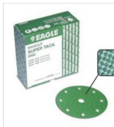
Kovax max cut