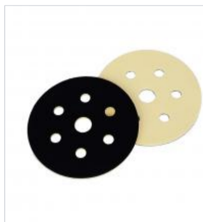
Підложка-перехідник ASSILEX INTERFACE PAD