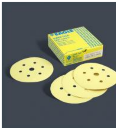
Kovax yellow film