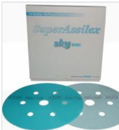
Kovax super assilex sky