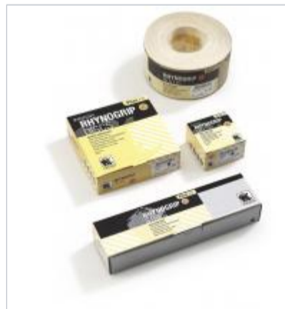
Rhynogrip plus line