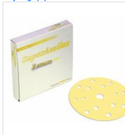
Kovax super assilex lemon