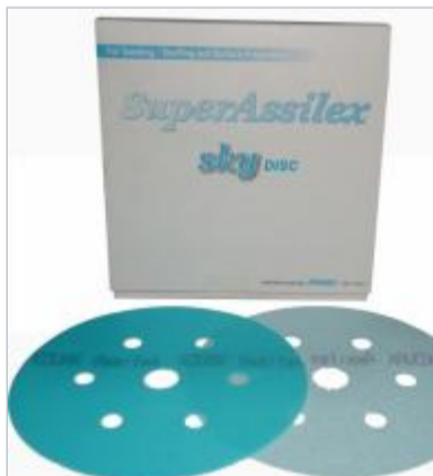
Kovax super assilex sky