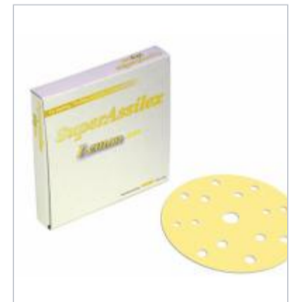
Kovax super assilex lemon