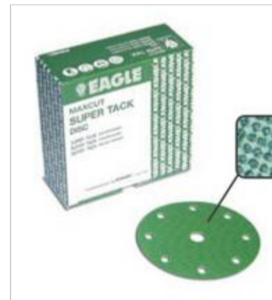
Kovax max cut