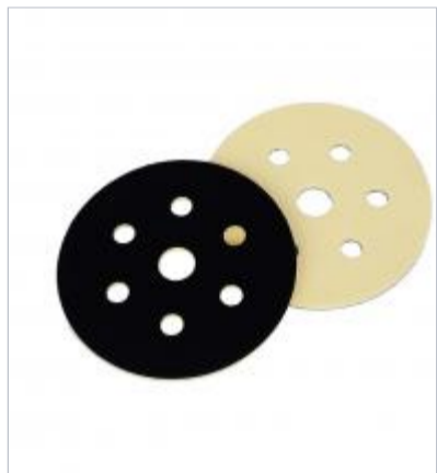
Підложка-перехідник ASSILEX INTERFACE PAD