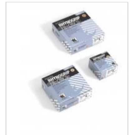
Rynogrip film line