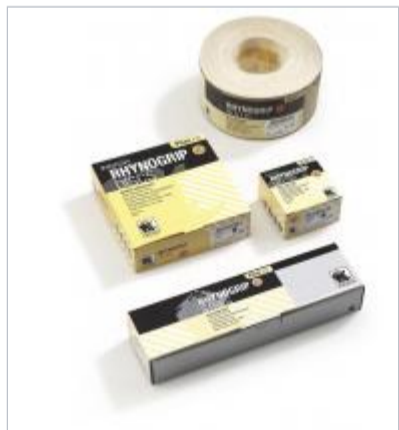
Rynogrip plus line