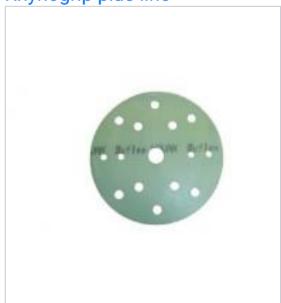
Kovax buflex dry green