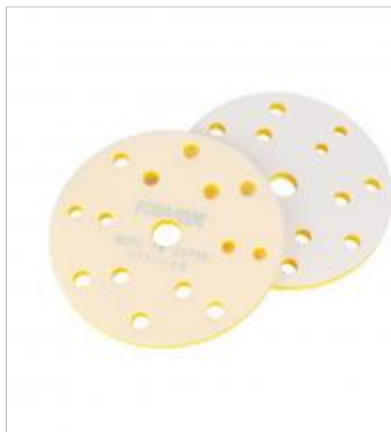
Підложка-перехідник BUFLEX DRY INTERFACE PAD