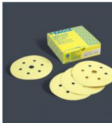
Kovax yellow film